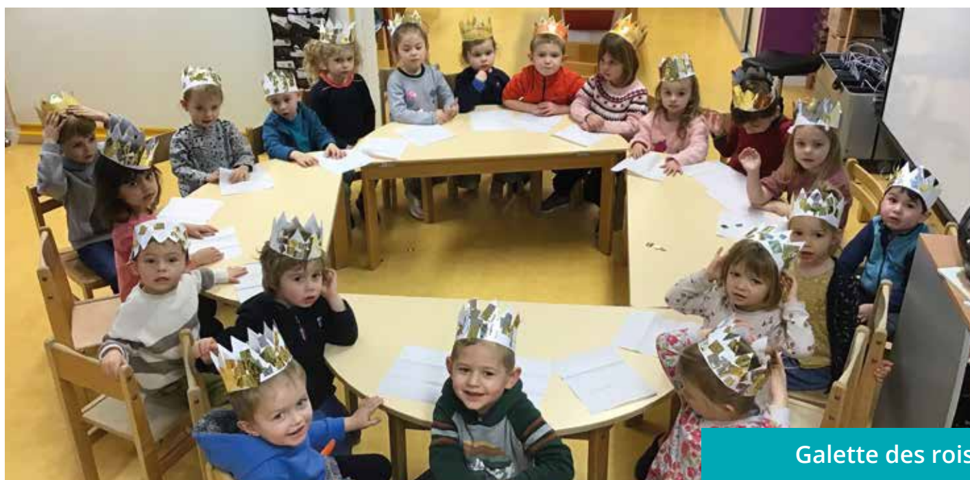
Galette des rois