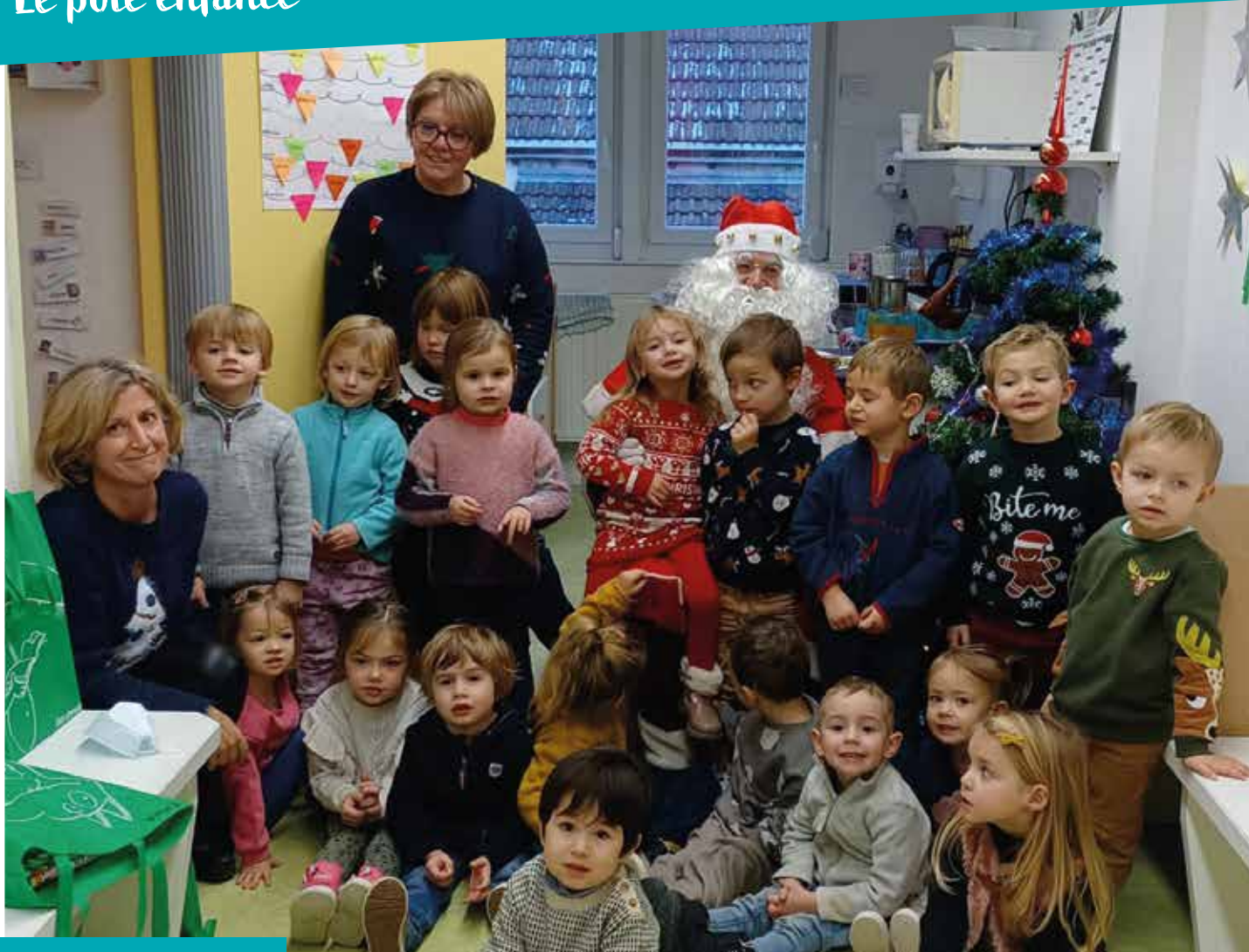
Noël à l'école