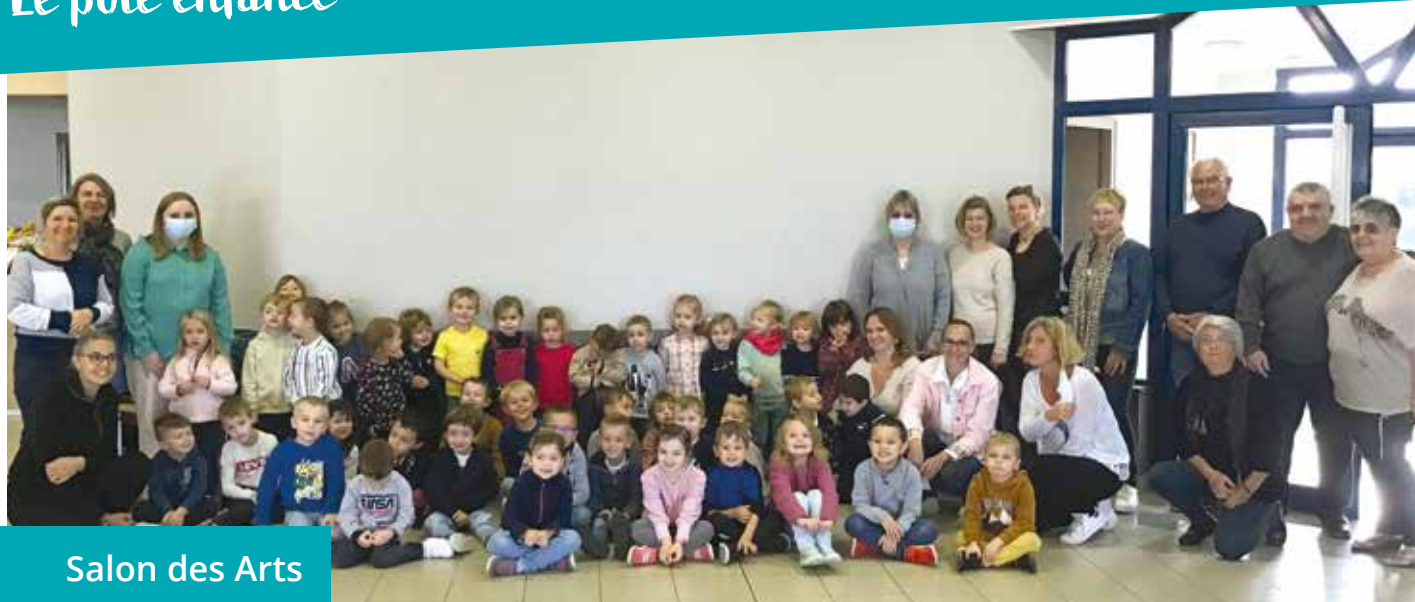
Salon des Arts